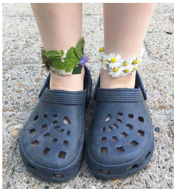
Udarbejdet af Sabina Hedegaard